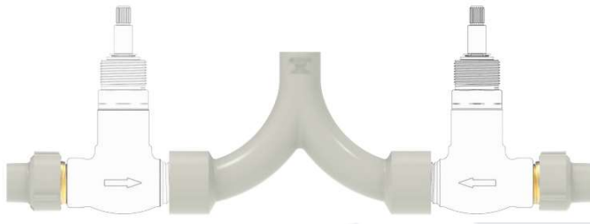
*conexão registro e misturados

Em alguns casos a instalação do CPVC Ultraterm Krona® necessita efetuar a interligação com peças metálicas, tais como registros de gaveta, registros de pressão, registro de esfera, entradas e saídas de aquecedores, misturadores e etc.